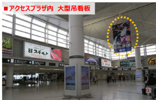
■ アクセスプラザ内 大型吊看板