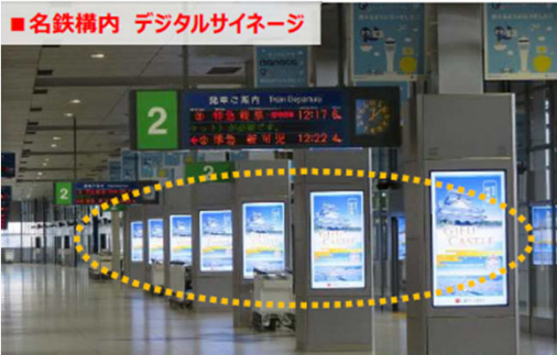
■ 名鉄構内 デジタルサイネージ